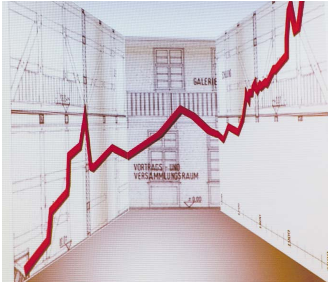
Blick in den Raum: Vom Erdgeschoss soll sich die rote Kurve über die Galerie bis ins Obergeschoss hinaufziehen. DARSTELLUNG (2): MUSEUMSREIF

Zweiter Schwerpunkt ist das attraktive Alleinstellungsmerkmal für das Stadtmuseum Brakel: Und dafür hat das Team von „Museumsreif“ eine Figur in den Mittelpunkt gestellt, die marktfähig und